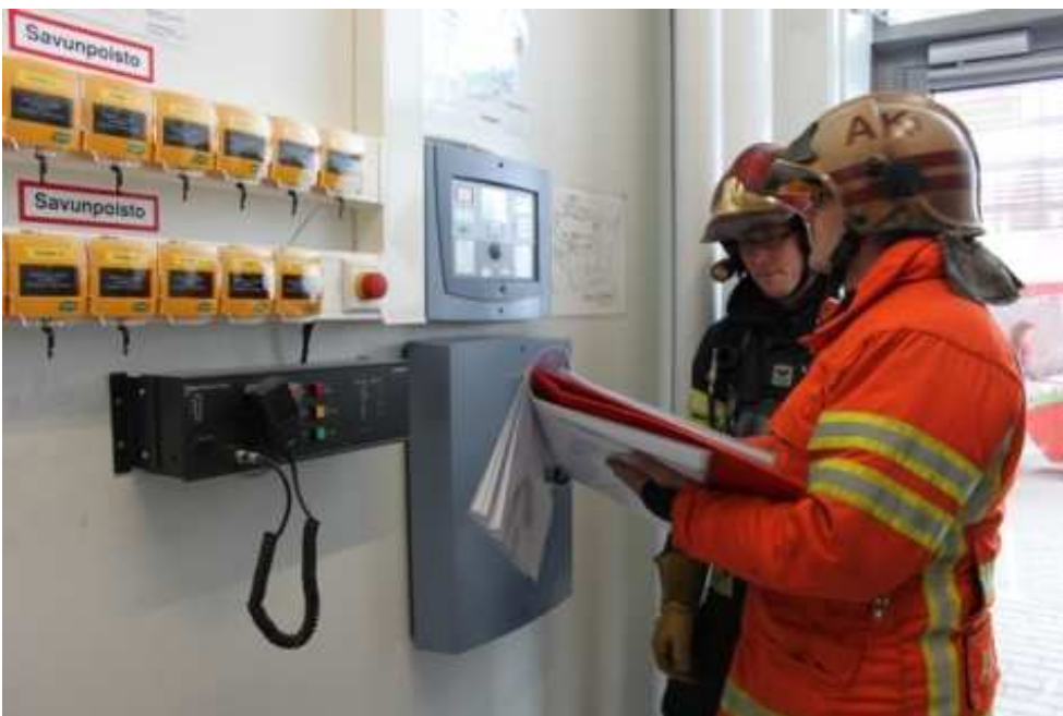
Toiminta automaattisella paloilmoinnilla on arkipäivää myös Kanta-Hämeessä.

”Kanta-Hämeessä on aiheutunut vuosittain automaattisista paloilmoittimista runsaat 600 hälytystä.”